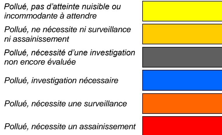
Figure 1 : Légende harmonisée du cadastre des sites pollués

Les autres informations publiées sur le guichet cartographique, notamment en ce qui concerne le type de site, reste inchangées.